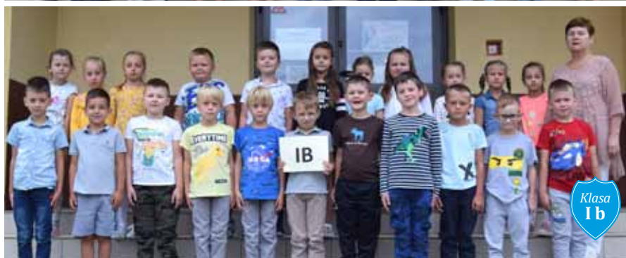
Klasa I b