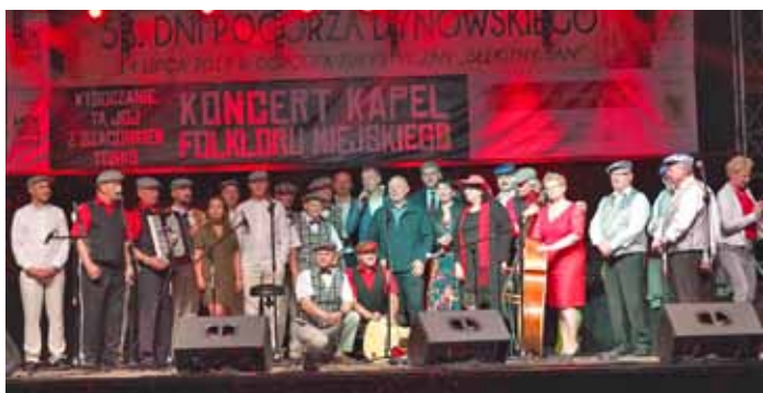
Koncert kapel folkloru miejskiego

W sobotę 13 lipca mieszkańcy Dynowa oraz turyści mieli okazję uczestniczyć w koncercie Kapel Folkloru Miejskiego. Wydarzenie było wyjątkowe z dwóch powodów. Po pierwsze był to koncert finałowy w ramach projektu „Opowieści wąskotorowe dla Niepodległej” realizowany od 15 czerwca na stacjach kolejki wąskotorowej Przeworsk-Dynów. Po drugie, uczestniczyliśmy w Jubileuszu 15-lecia działalności scenicznej Kapeli „Tońko”. W programie wystąpiły kapele z Podkarpacia: Wysoczenie/ okolice Łańcuta i „Ta joj” z Przemyśla oraz Kapela z Szaconkiem z Włocławka. Oczywiście koncert rozpoczęła Kapela „Tońko”. Gratulujemy wszystkim udanych występów a Kapeli „Tońko” kolejnych wspaniałych jubileuszy. Program prowadził Krzysztof Respondek, który bawił wspaniałym humorem oraz imponował profesjonalnym prowadzeniem koncertu.