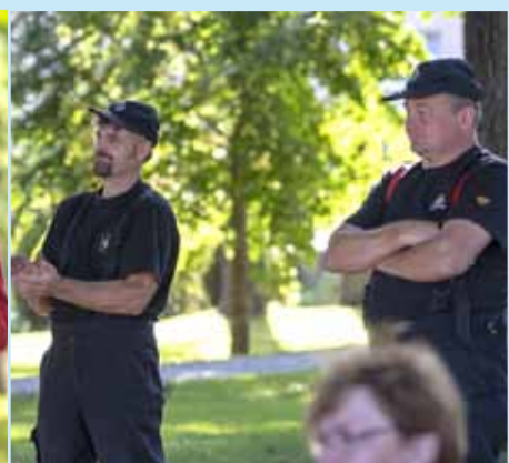
Strażacy OSP Dynów Przedmieście