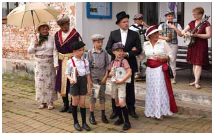
Stacja Przeworsk, T.G. Sokół

Finał i występy przedszkolaków odbędą się 19 października w Ośrodku Kultury i Miasta Kańczuga. Zaś finał konkursu literackiego