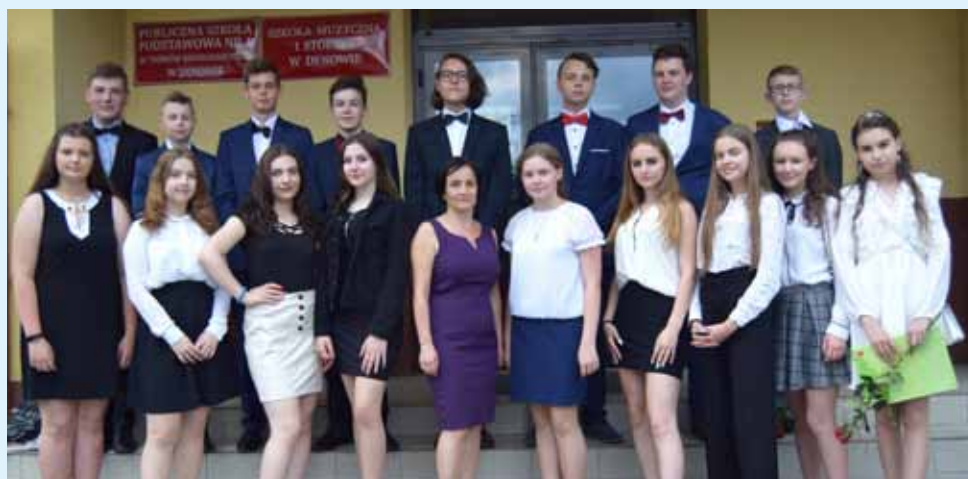
Absolwenci – klasa 8 c