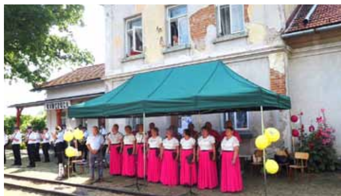
Stacja Kańczuga

zorganizuje 26 października Miejski Ośrodek Kultury w Przeworsku.