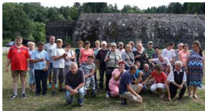
Schron kolejowy z czasów II wojny światowej Stęcina Cieszyńska

Kierownik Środowiskowego Domu Samopomocy w Dynowie