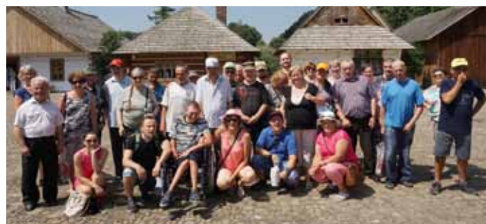
Muzeum Budownictwa Ludowego i Park Etnograficzny w Sanoku

Na koniec wycieczki wszyscy zgodnie stwierdzili, że nie chcieliby wrócić ani do czasów wsi średniowiecznej, ani tym bardziej do czasów wojny.