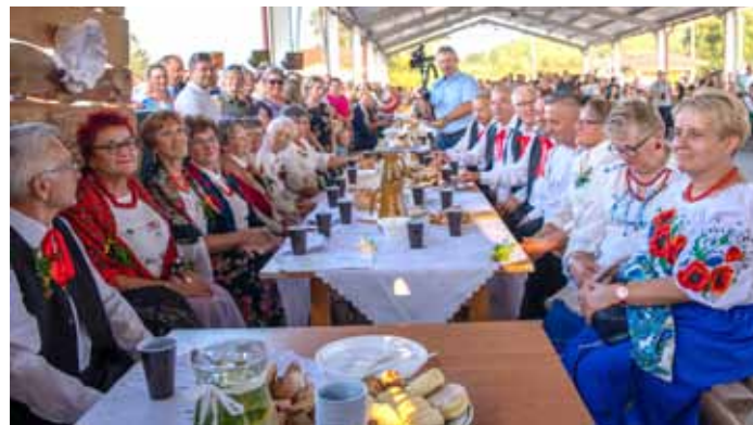
„Pogórzańskie wesele 2019”

Dziękujemy tym osobom, które przygotowywały „Pogórzańskie wesele” od strony organizacyjnej, merytorycznej i technicznej: