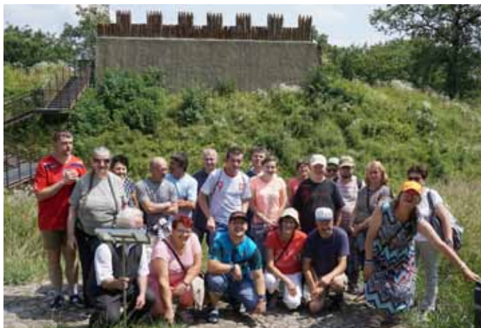
Skansen Archeologiczny Troja Karpacka w Trzcianicy

Tradycyjnie zawody kończyły się „biegiem ku słońcu”.