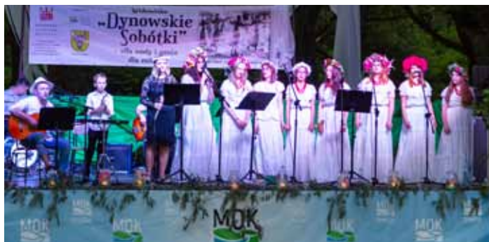
Dynowskie Sobótki