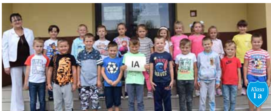
Klasa I a