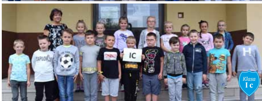
Klasa I c