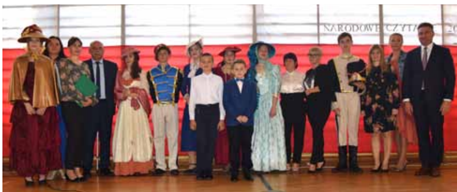
„Narodowe Czytanie 2019”, fot. Radosław Telega