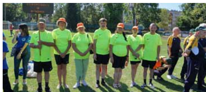
Olimpiada Osób Niepełnosprawnych w Rzeszowie