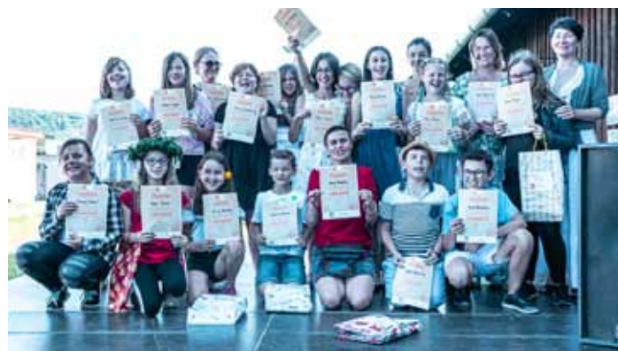
Lato w teatrze