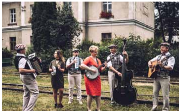
Stacja Dynów